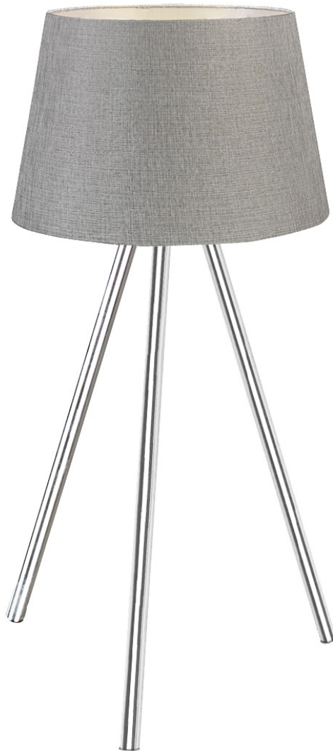
TABLE LAMP / LAMPE DE TABLE (BRUCE)

Nous vous remercions de choisir les luminaires Xtricity pour l'éclairage de votre domicile. Moyennant un entretien adéquat, ce produit vous fournira un éclairage plaisant et agréable. Suivez attentivement les instructions afin d'assurer le fonctionnement convenable et sécuritaire de ce produit durant des années.